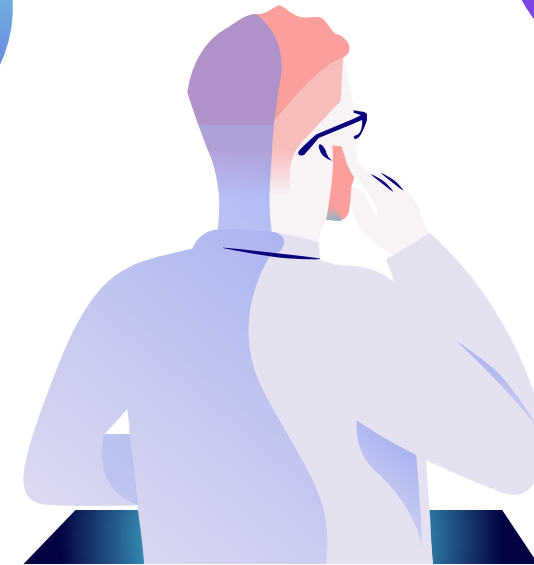
IMAGEN DE MARCA