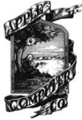
Apple's First Logo (1976)